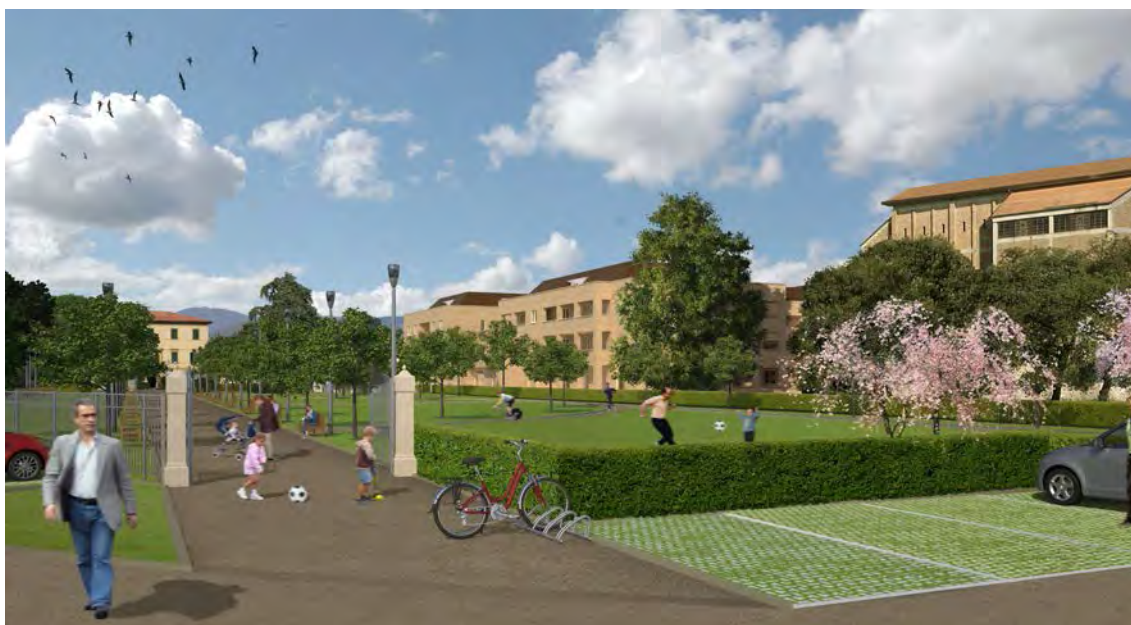
Rendering della "Cittadella Solidale", Pistoia

Approvato dal Consiglio Generale in data 23 ottobre 2014